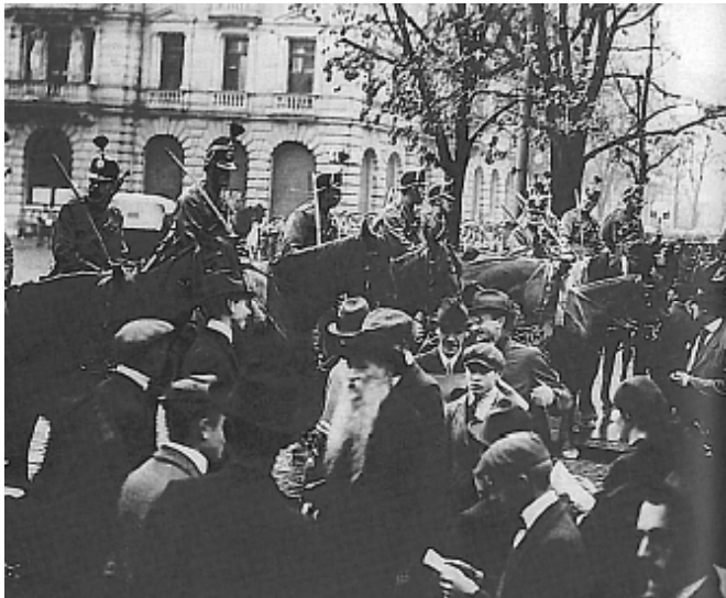
Geschichte der Schweiz und der Schweizer, S. 90.

L'historiographie suisse appelle habituellement "grève générale" celle de novembre 1918, qui toucha tout le pays et fut l'une des crises politiques majeures de l'Etat fédéral. Elle représenta le point culminant de violents conflits sociaux qui, en Suisse comme dans d'autres pays européens, se produisirent vers la fin de la Première Guerre mondiale.