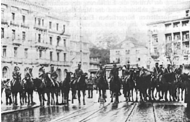
Geschichte der Schweiz und der Schweizer, S. 766.